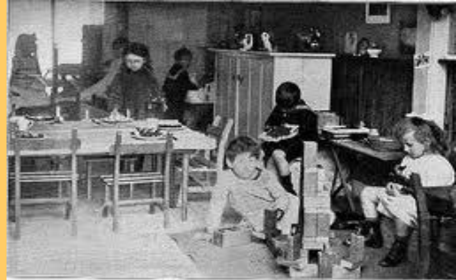
Montessori-school te Dordrecht (de eerste klas te links).

En 1901 funda en Roma una escuela de enseñanza especial