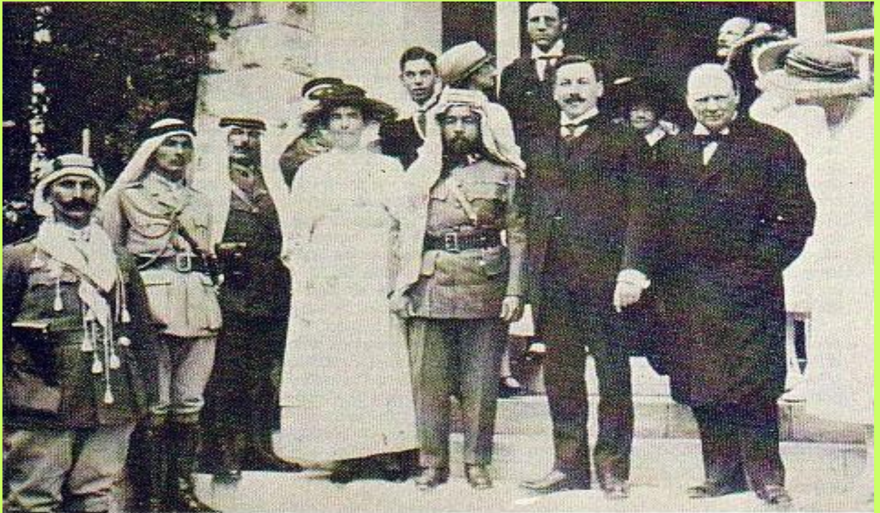
El emir Abdullah (en el centro, con uniforme) acompañado por sir Herbert Samuel y Winston Churchill, Jerusalem 1921