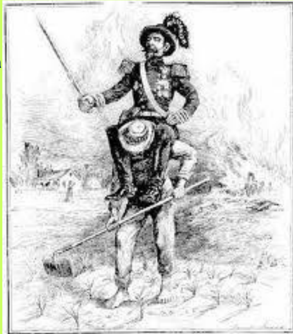
THE WHITE MAN'S BURDEN. - The Rand's Horn, Chicago.

Implicó no solo una expansión comercial y nuevas fuentes de recursos energéticos para Europa, sino además, invasión territorial, dominio político, ocupación militar y una explotación continua de las colonias y semi-colonias que perdieron su soberanía